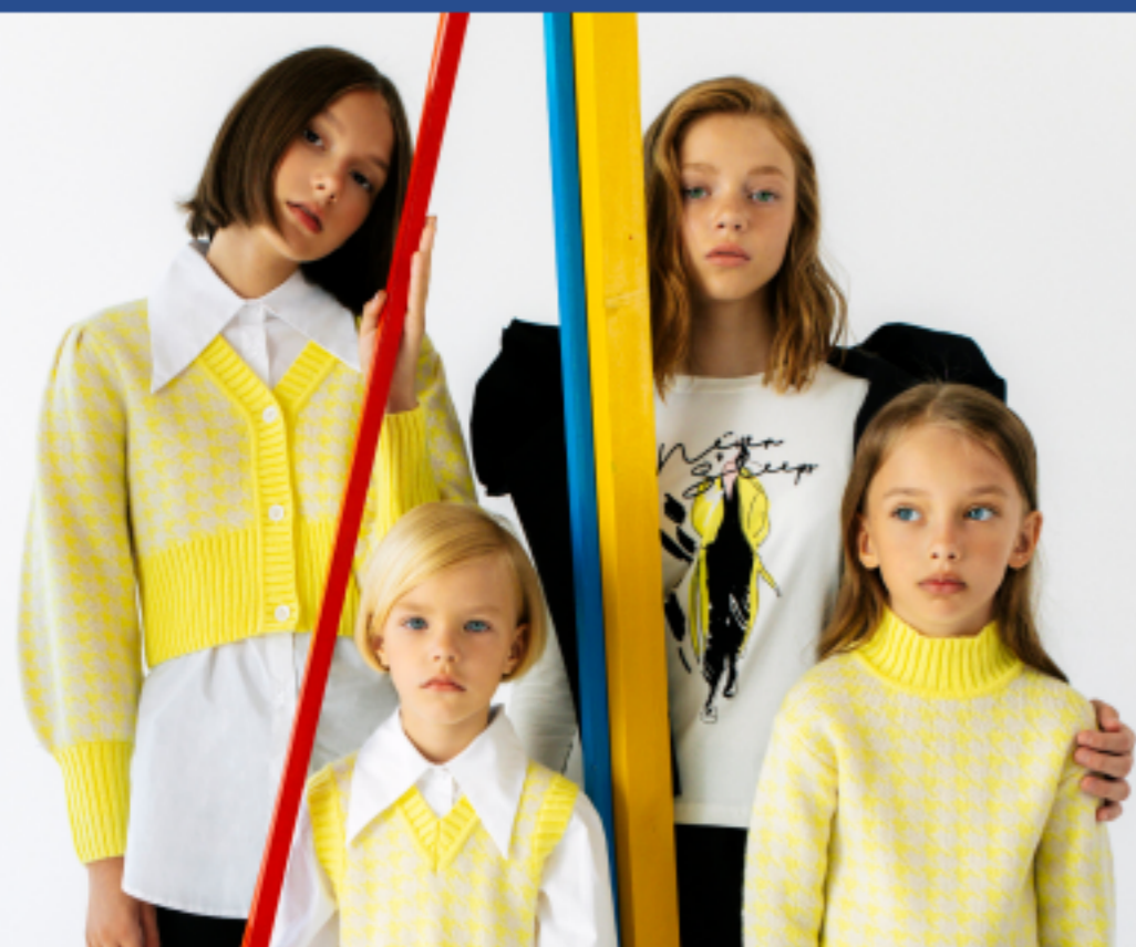
To Be Too

Компания Vebakids является официальным дистрибьютором брендов: